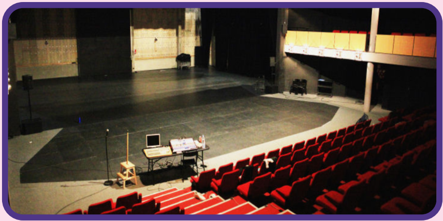
La salle de spectacle