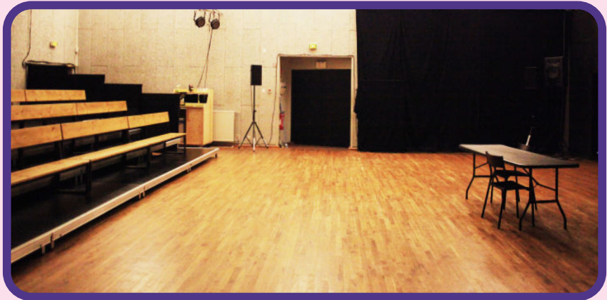
La salle de recherche